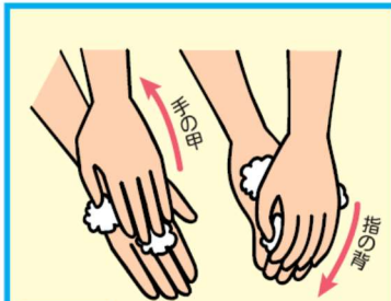
4 手の甲、指の背を洗う