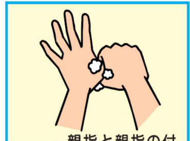
6 親指と親指の付け根のふくらんだ部分を洗う