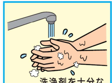
9 洗剤を十分な流水でよく洗い流す