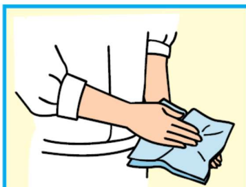
10 手をふき乾燥させる