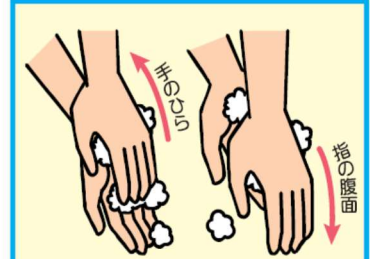
3 手のひら、指の腹面を洗う