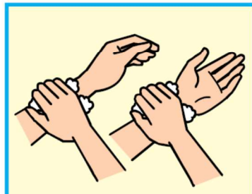
8 手首を洗う(内側・側面・外側)