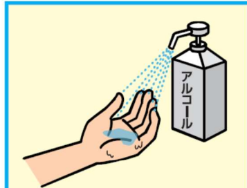
11 アルコールによる消毒