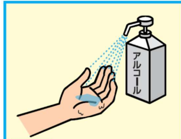
11 アルコールによる消毒